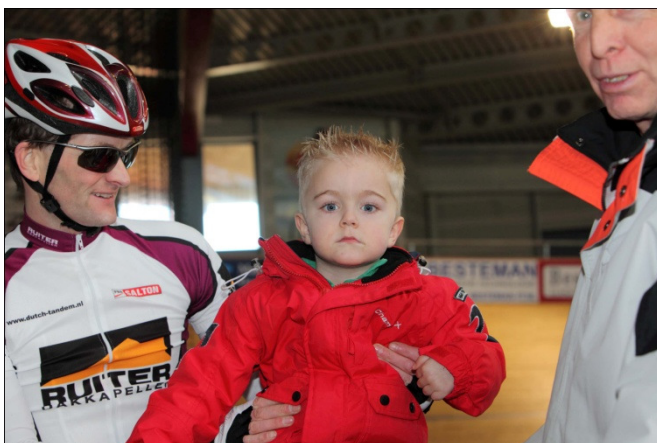
Even alvast proeven hoe een tandem zit

De hele ploeg aangepast wielrennen was hierbij aanwezig en er werd hard gereden.